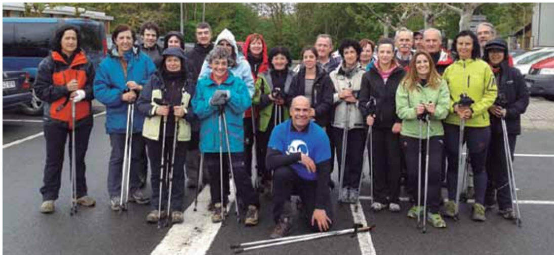
Grupo de iniciación de Zigoitia al Nordic Walking.

Testuak eta irudiak www.nordicwalkingunea.net webgureak utzita.