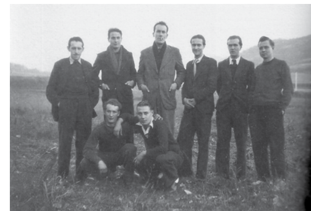
René Char (Alexandre kapitaina), hirugarrena ezkerretik hasita.