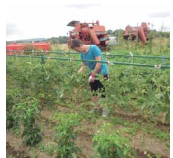
BARATZEAN_ 'Senarrak dio herriko onena daukadala, ja, ja, ja!'

- Amaitzeko, gaurko gizarteak zuen lana balioesten duela uste duzu? Bai, nire auzotarren gehiengoak ulertzen eta baloratzen du landa-eremua mantentzeko egiten dugun lana. Beharbada hemen jaiok gehiago, gure bizimodua hobeto ezagutzen dutelako.