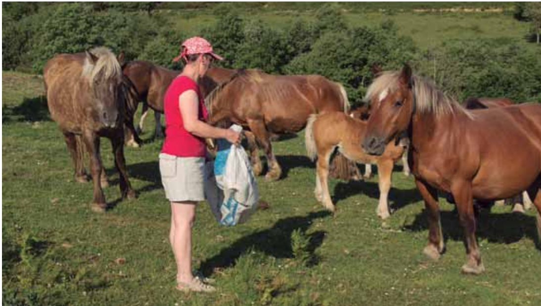
EUSKAL HERRIKO ZALDIAREN HARAGIA_ Maitek berrogeita hamar bat behor eta zaldi ditu.